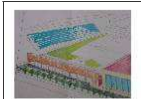
Complexo Desportivo (Campo Relvado)