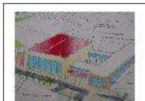
Complexo Desportivo (Piscina e Campo coberto)