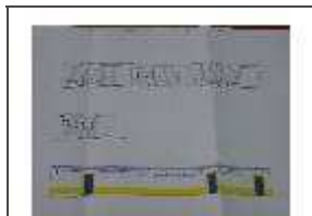
Balneários de Apoio Campos Sintéticos

Com um crescimento não planeado ao longo dos anos, as diferentes construções existentes, encontram-se implantados pelo terreno de uma forma desordenada e com evidente prejuízo da interligação das funções que se pretendem agora unidas numa unidade coerente.